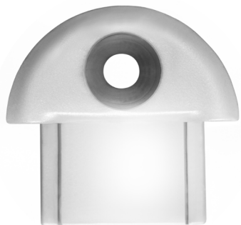
KONCOVKA K PROFILU AL-05 PLAST (00200721)